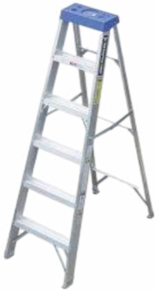
TIPO III - I - IA