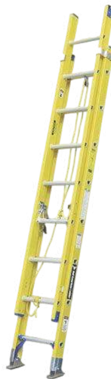
TIPO II - I - IA