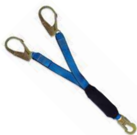
Doble línea de vida C026E (Tractel)