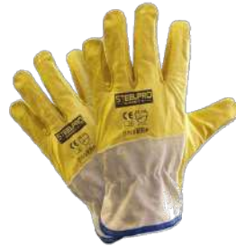
Guantes de badana (Steelpro)