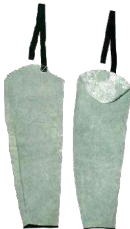
Mangas de cuero de cromo