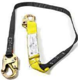
Línea de vida 209512