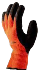
Guante de PVC Multiusos