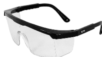
Lentes Nitro (Steelpro)