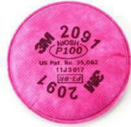
Filtros P100 2091, 2096 (3M)