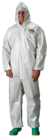
Traje ChemMax para químicos