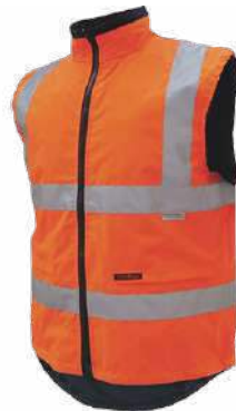
Rompi Safety KK-13