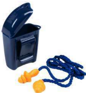
Tapones auditivos 1271 (3M)