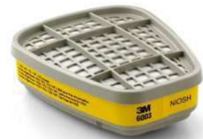
Cartucho contra vapores orgánicos y gases ácidos (3M)