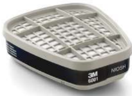
Cartucho contra vapores orgánicos (3M)