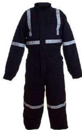
Mameluco térmico con polar interior