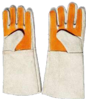
Guantes de cuero de cromo