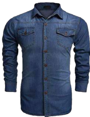
Camisa jean para soldador