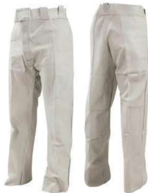
Pantalón de cuero de cromo