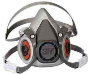
Respirador 6200 Media cara (3M)