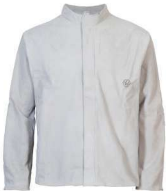
Casaca de cuero de cromo