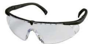
Lentes Virtua V8 (3M)