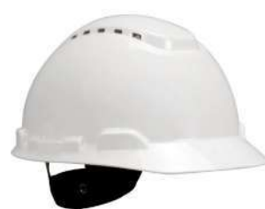
Casco H700 (3M)