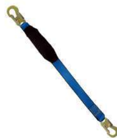
Línea de vida C006G (Tractel)