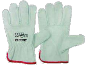
Guantes de badana (Clute)