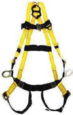
Arnés 10911 de anillos (3M)