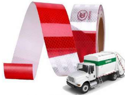
Cinta de marcaje vehicular 2" y 4" de ancho