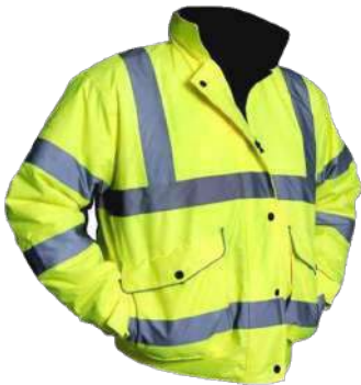
Casaca Térmica - Thinsulate (3M)