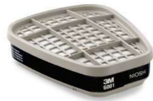
Cartucho 6001 (3M)