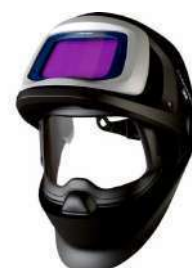
Careta Speedglas 9100FX (3M)