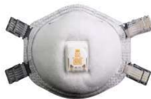
Respirador desechable 8214 (3M)