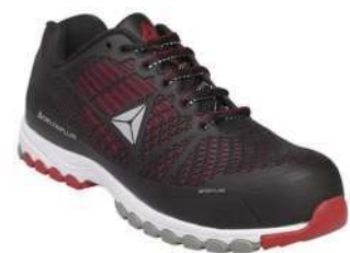
Zapatilla dieléctrica S1P (Delta Plus)