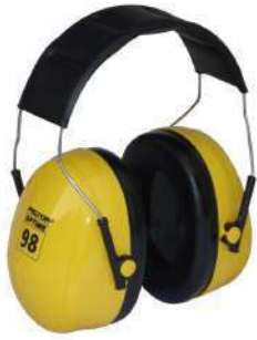
Optime 98 H9A Peltor (3M)