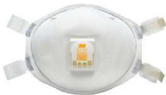
Respirador desechable 8212 (3M)