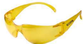
Lentes Vision (Clute)