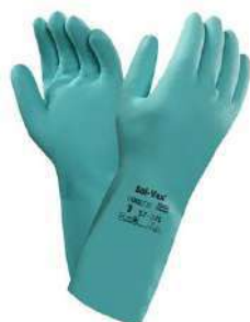
Guante de Nitrilo