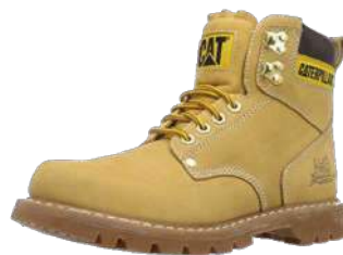
Botín Steel Toe (CAT)