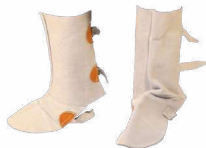
Escarpines de cuero de cromo