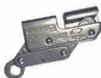
Freno de Cable