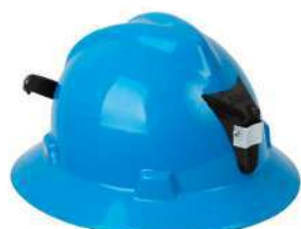
Casco tipo minero (MSA)