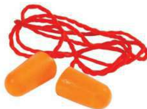
Tapones auditivos 1110 (3M)