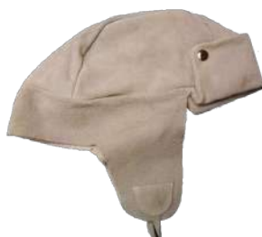
Chavito de cuero de cromo