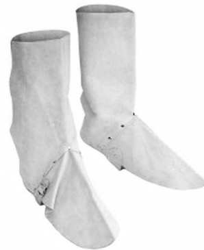
Cubre botas de cuero de cromo