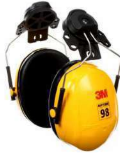
H9P3E Peltor (3M)