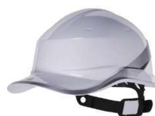
Casco Diamond (Delta Plus)