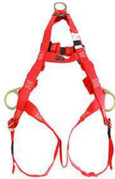
Arnés Saturn 1021 de 3 anillos para soldadores (3M)