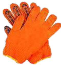
Guante de hilo Hilter