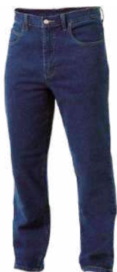
Pantalón de jean 14 onzas