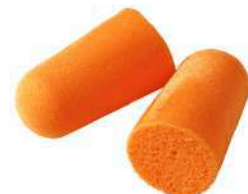
Tapones auditivos 1100 (3M)