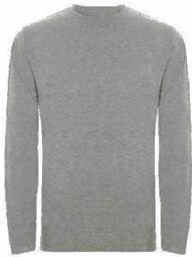
Polo 20/1 cuello redondo