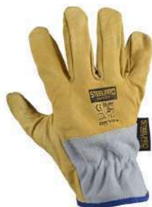
Guante minero volteado