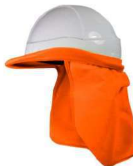
Cortavientos para casco