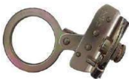
Freno de Soga

•Ultra -Seife con gancho de 3/4" y dos ganchos de 2 1/4"