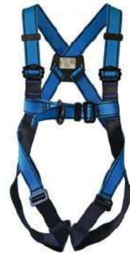
Arnés de 3 anillos A042 (Tractel)