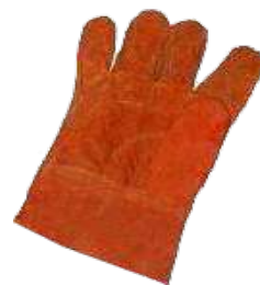
Guante cromo con refuerzo