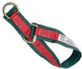
Eslinga de anclaje