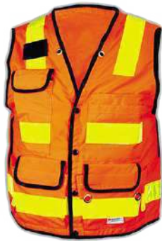
Rompi Safety KK-12