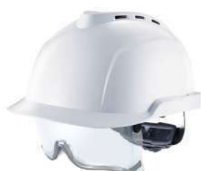
Casco Vgard (MSA)