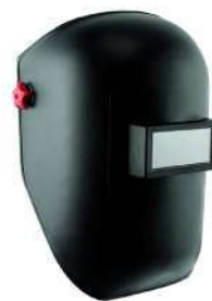
Careta para soldar