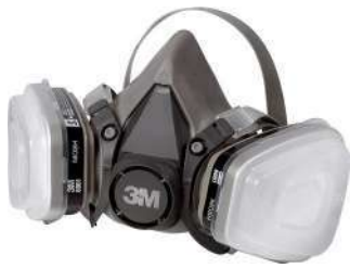
Kit Pintor (3M)