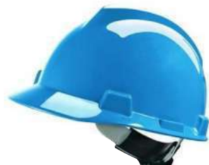
Casco tipo jockey (MSA)