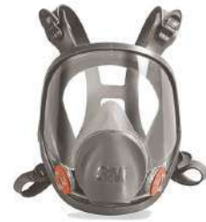
Mascara 6800 Full Face (3M)