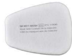
Pre Filtro 5N11 (3M)