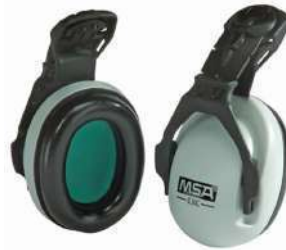
Orejeras EXC (MSA)