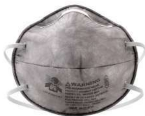
Mascarilla 8247 (3M)