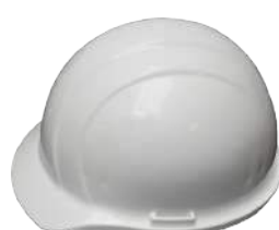
Casco Omega (3M)