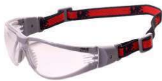
Lentes Virtua Plus (3M)