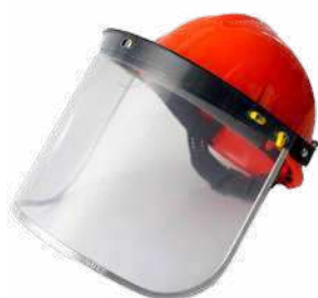
Casco con careta para esmerilar