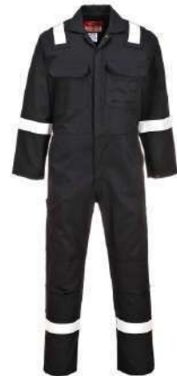
Buzo Bizweld BIZ5