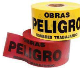
Cinta de señalización