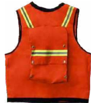
200 - HD Surveyors