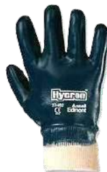
Guante de Neoprene