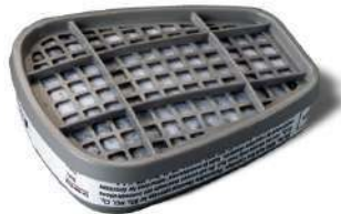
Cartucho contra gases ácidos (3M)