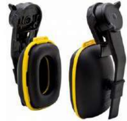
Orejeras Samurai (Steelpro)