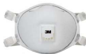
Mascarilla 8514 N95 (3M)