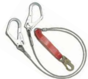
Doble línea de vida con cable de acero

•Con un gancho de 3/4" y dos ganchos de 2 1/4"