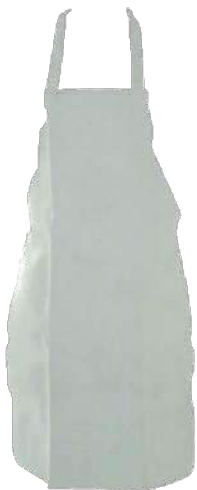
Mandil de cuero de cromo