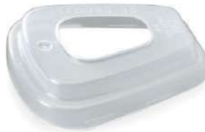
Retenedor 501 (3M)