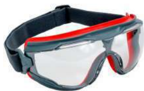
Lentes Google 122 (3M)