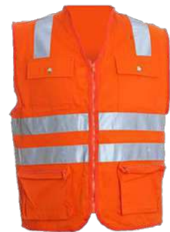
Chaleco tipo Reportero