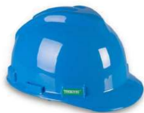
Casco tipo jockey (Tridente)