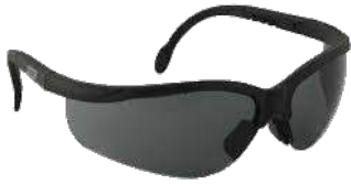
Lentes Maverick (MSA)