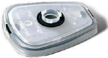
Retenedor 502 (3M)