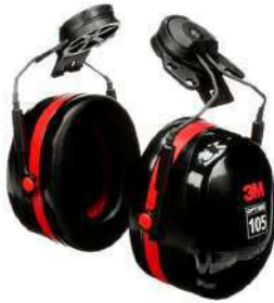
Orejeras Optime 105 (3M)