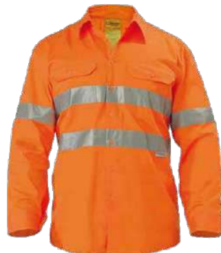
Camisa de Drill