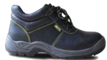
Botín Bulldozer (Spro)