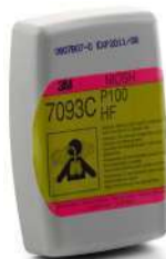
Filtro 7093C (3M)