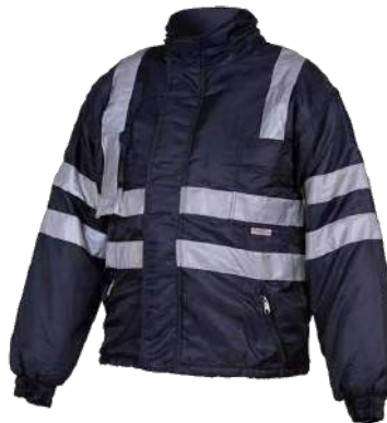
Casaca Térmica - Polar interno