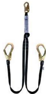
Doble línea de vida 209552

•Con un gancho de 3/4" y dos ganchos de 2 1/4"