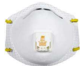
Respirador valvula 8511 N95 (3M)