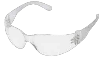
Lentes Virtua (3M)