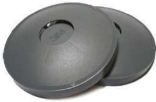
Tapas para filtros serie 2000 (3M)