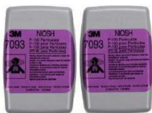
Filtro 7093 (3M)