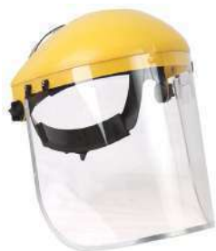
Careta para esmerilar