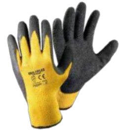
Guantes Multiflex (Steelpro)