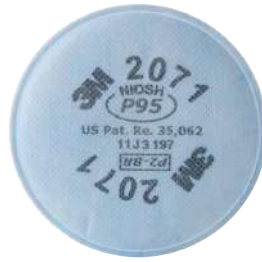
Filtros P95 2071, 2076 (3M)