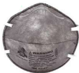
Mascarilla 8246 (3M)