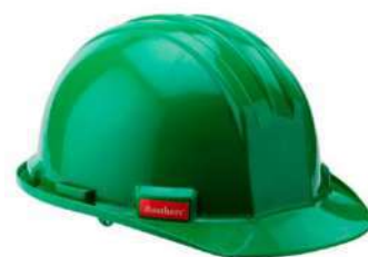
Casco tipo jockey (Bellsafe)