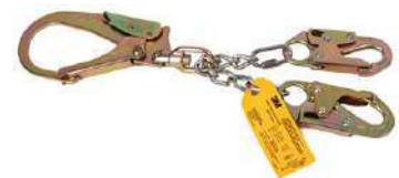
Ensamble de cadena SP3706