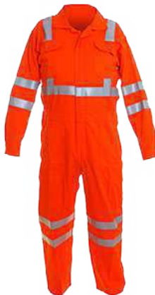
Overol drill con cinta reflectiva