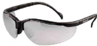
Lentes Maverick (MSA)