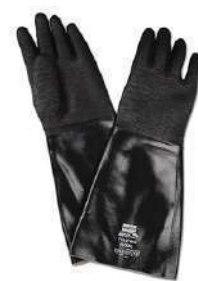
Guante de Neoprene