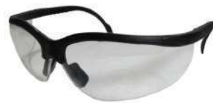
Lentes Virtua V6 (3M)