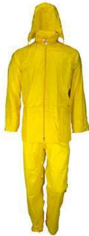
Traje de PVC (Galaxy)