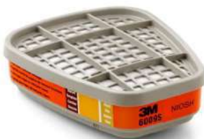
Cartucho contra vapores de mercurio (3M)